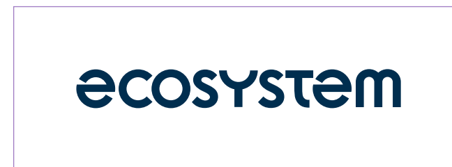
Logo monochrome bleu nuit