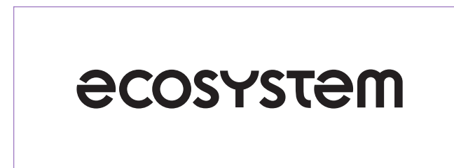
Logo monochrome noir