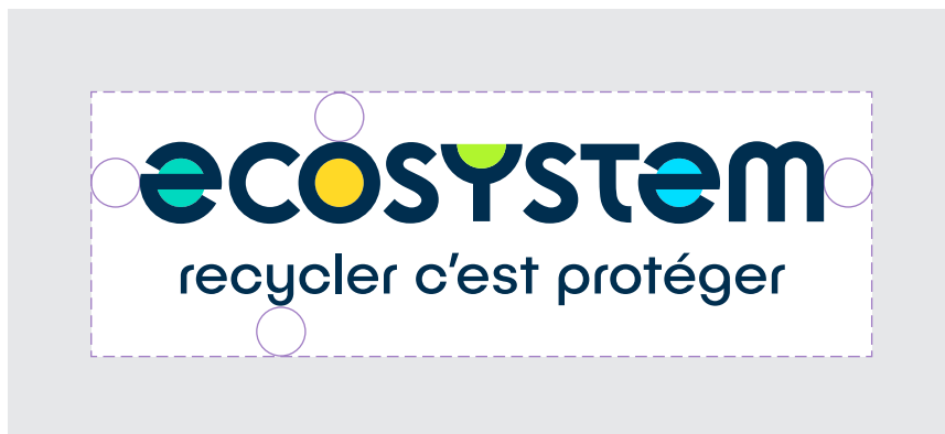
Logo avec signature